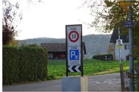
Bilder: Beispiele heutiger Zoneneingänge